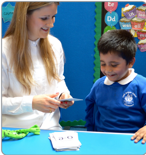
Precvičovanie Speed Sounds v triede.